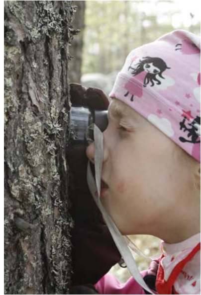
Hilla otti luupin avuksi luontotutkimuksiin.

”Ojenna jalka, nilkkaa kierrä. Asento vaihda, ettei hierrä. Hartiaan tartu, kättä kierrä. Pystyyn hyppää ja itsesi kierrä: ympäri ympäri näin ja sitten toisinpäin.”